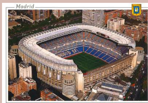
Stadion Realu Madrid