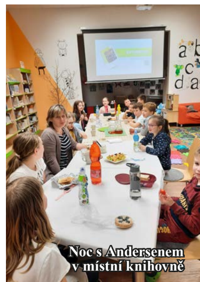
Noc s Andersenem v místní knihovně