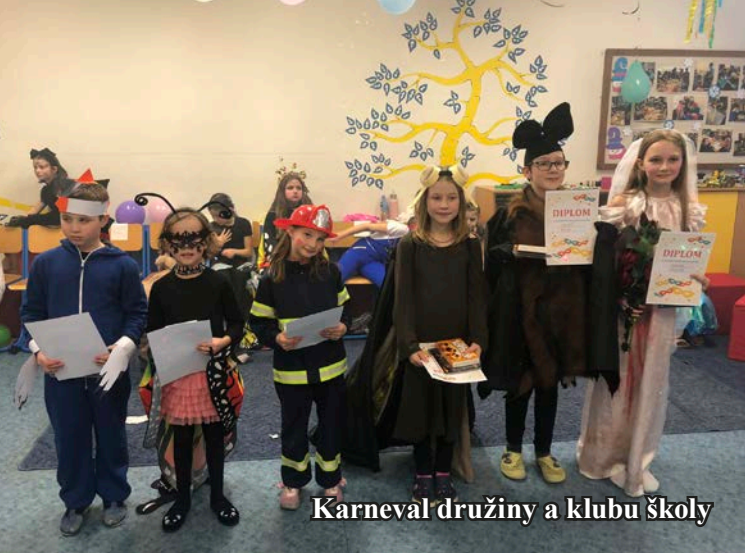
Karneval družiny a klubu školy