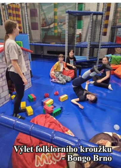
Výlet folklorního kroužku - Bongo Brno