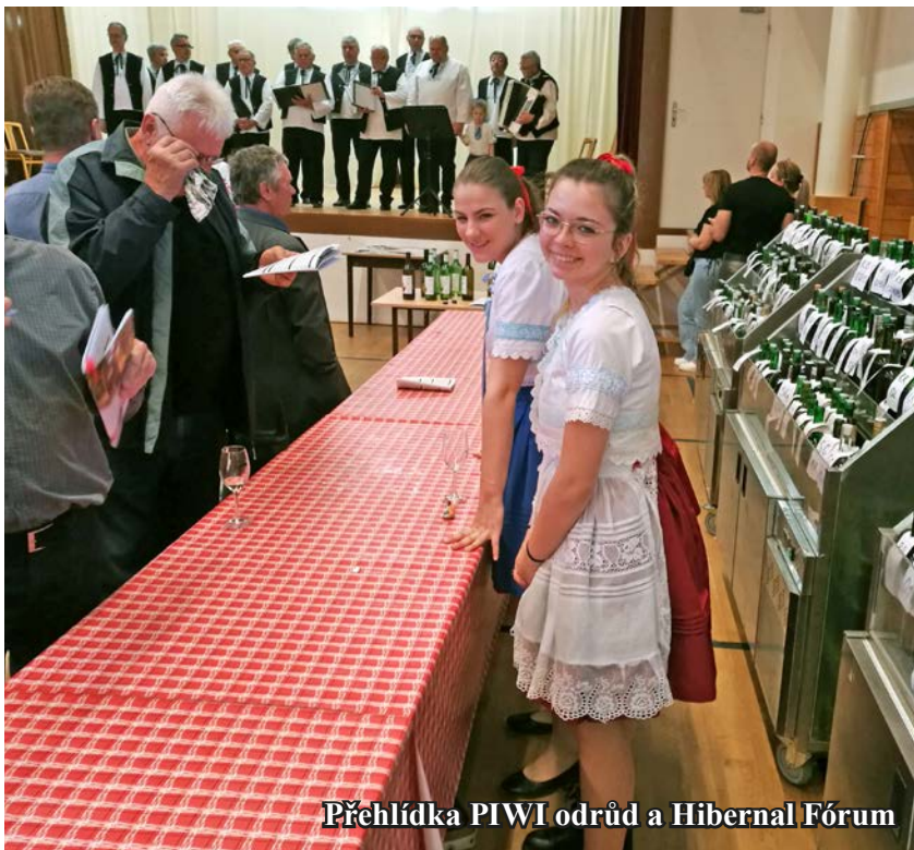
Přehlídka PIWI odrůd a Hibernál Fórum