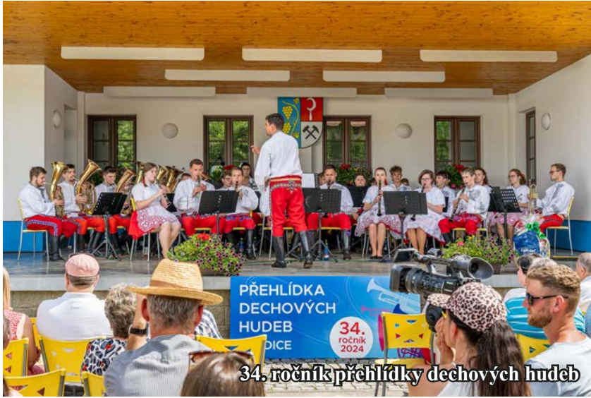
34. ročník přehlídky dechových hudeb