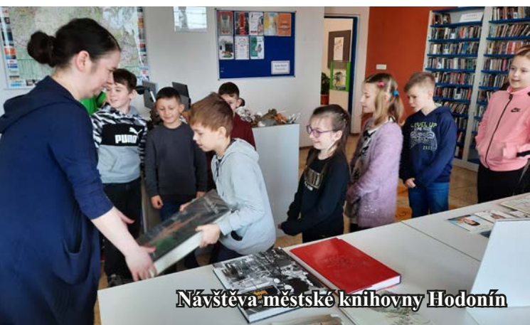
Návštěva městské knihovny Hodonín