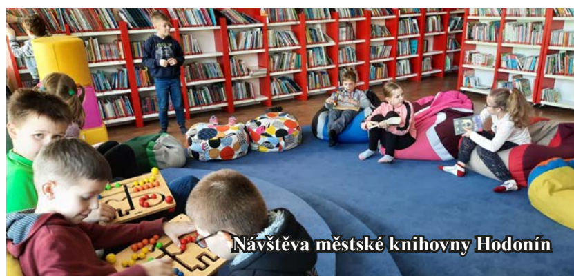
Návštěva městské knihovny Hodonín