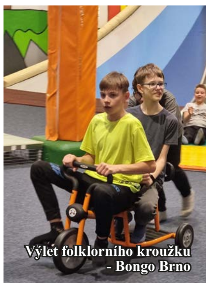
Výlet folklorního kroužku - Bongo Brno