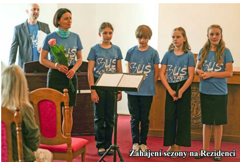
Zahájení sezony na Rezidenci