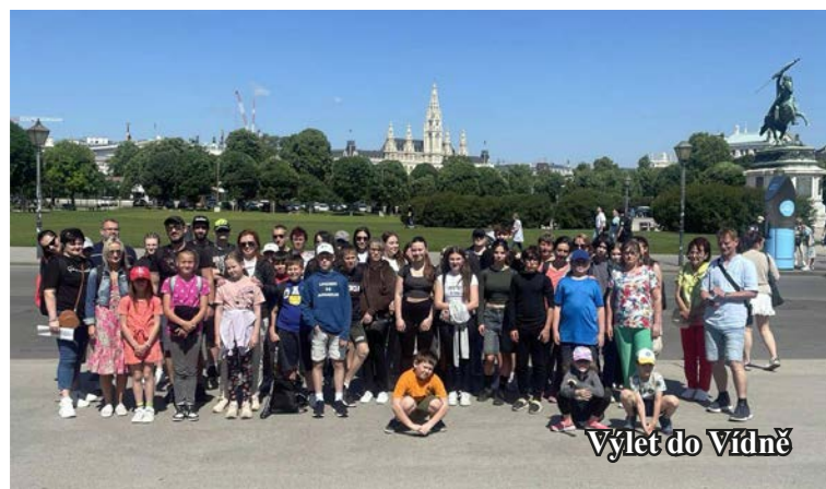
Výlet do Vídně