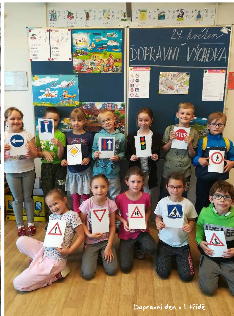
Dopravní den v I. třídě