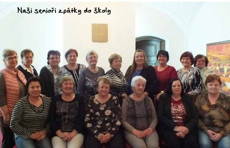
Naši seniři zpátky do školy