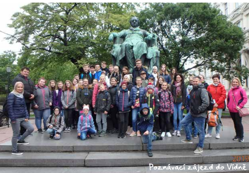
2019 Poznávací zájezd do Vídně